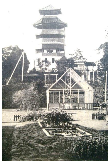
近隣國小盆水壇花と寒望殿内園日龍船之江（瀬片州相）