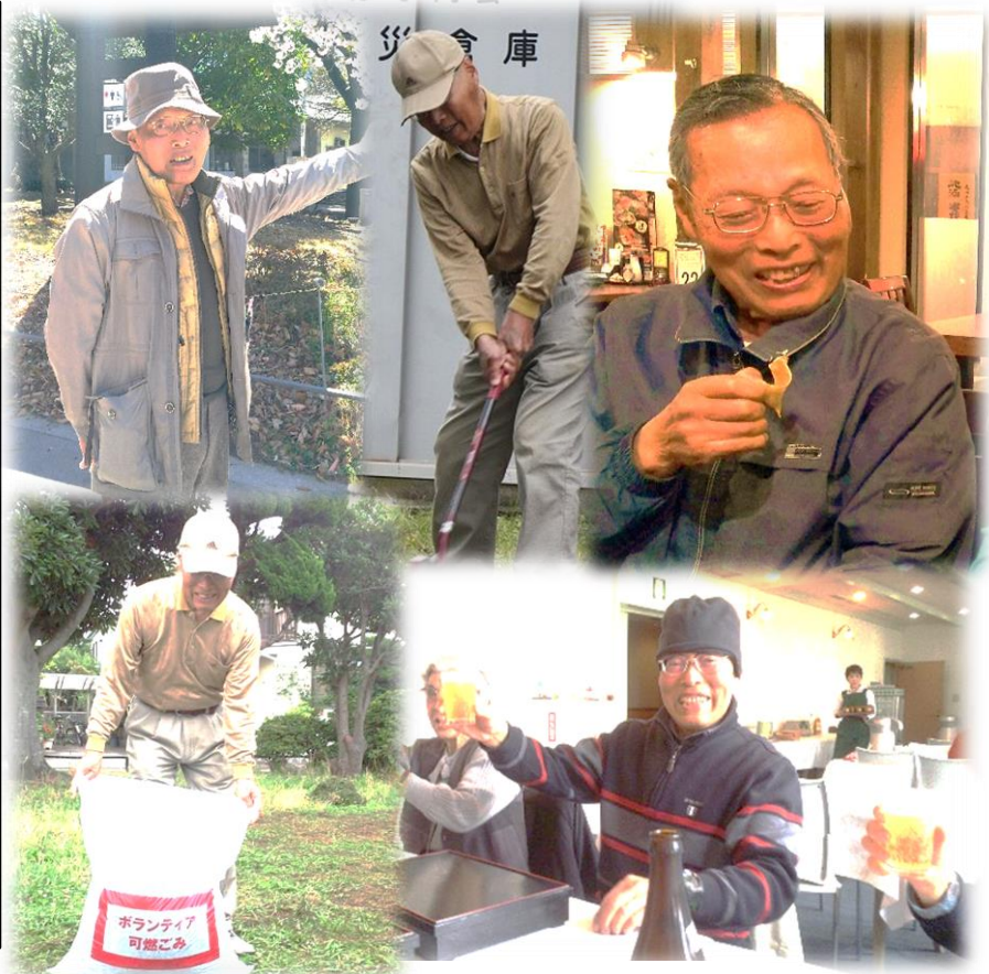
在りし日の花土さん