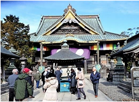
葛飾柴又帝釈天は豪華なお寺です