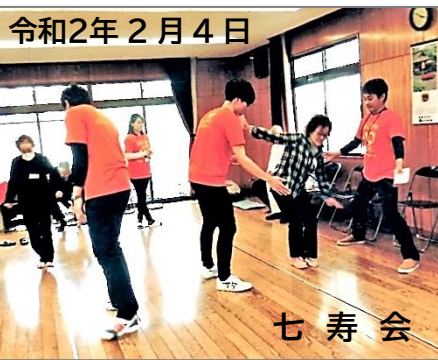
令和2年2月4日 プラス・テンの健康度チェック