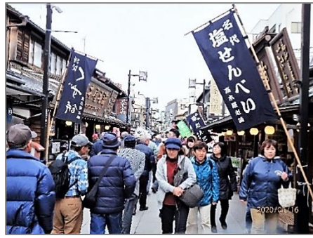
葛飾柴又門前町・寅さんの町