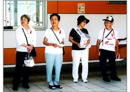
共同募金おねがいしまーす