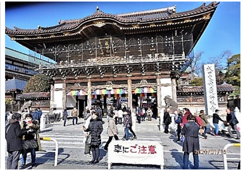
成田山新勝寺初詣で参加者 64 名