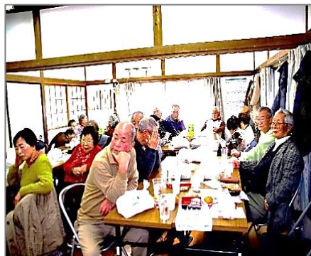
七寿会 長寿会・新年会の友愛懇親会