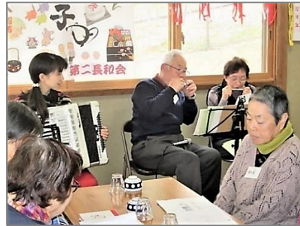
第二長和会・新年音楽懇親会