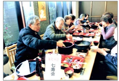
「成田山初詣で」の招福膳の昼食