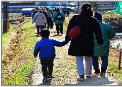
令和2年元日の初詣で神社巡り