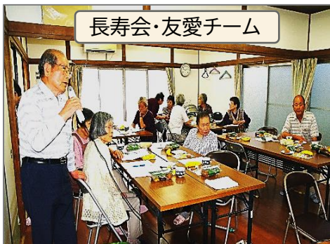
長寿会・友愛チーム