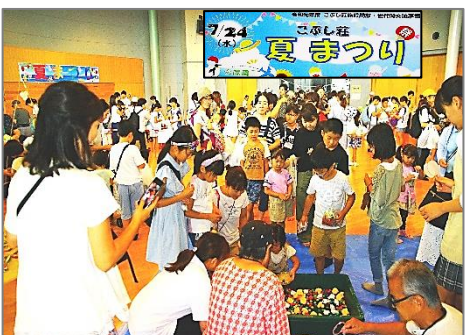
こぶし荘・夏まつり・7月24日(水)