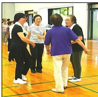
「長後 2019 健康体操のつどい」