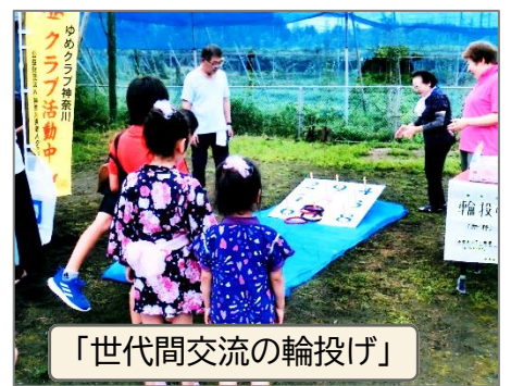
「世代間交流の輪投げ」