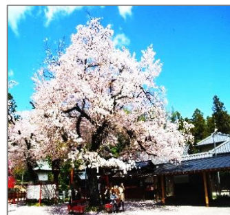
東照宮内の見事な桜

「平成」最後のバス旅行が4月9日(火)長後老連主催で行われました。参加者90名行き先は群馬県の「世良田東照宮」で、桜がとてもきれいでした。「東照宮」は三代将軍・徳川家光の命により創建されました。徳川氏の遠祖、世良田義季の墓があり、歴代徳川家が信仰され江戸時代には、大変さかえました。