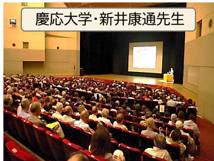
第2部の講演「健康長寿の秘訣」