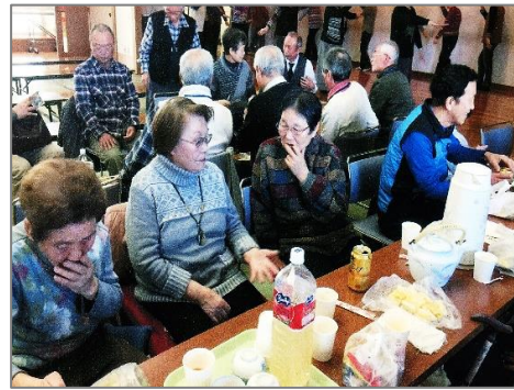
東五月会の懇親会