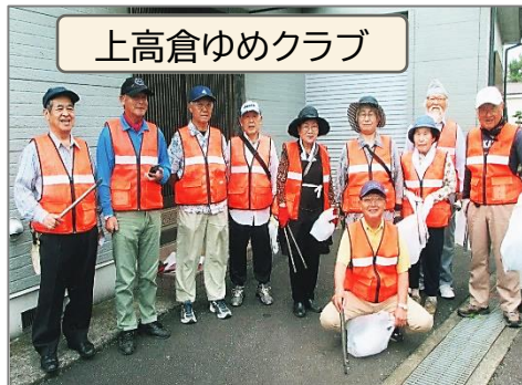
上高倉ゆめクラブ