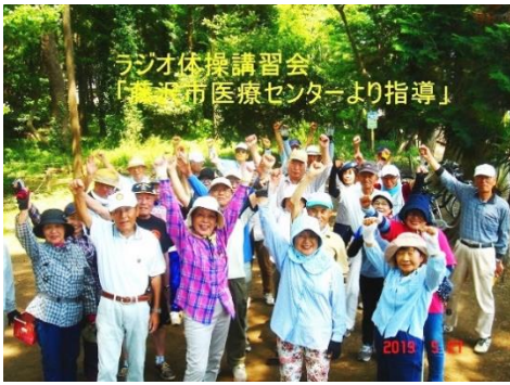
ラジオ体操講習会 「藤沢市医療センターより指導」