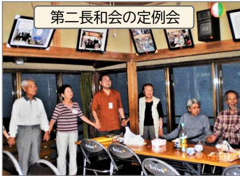
第二長和会の定例会