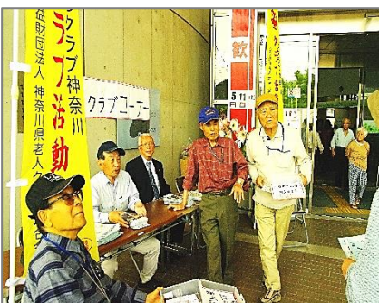
こぶしまつり・5月11日(土)

100歳を超えた人の血液を調べました。世のために働き「生きがいを感じる人」は病気になるにくいそうですよ。もちろん食事、運動、睡眠も健康長寿には欠かせない要素だと言うことですよ。