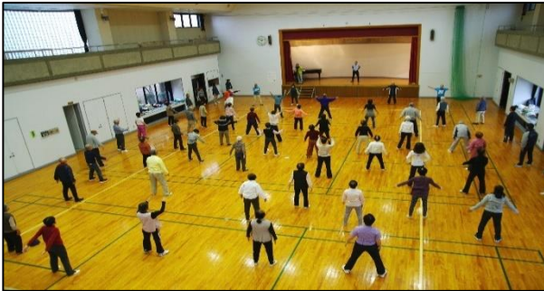
ふじさわ プラス・テン体操