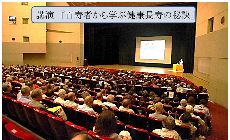
講演『百寿者から学ぶ健康長寿の秘訣』