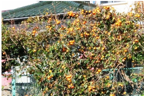
秋の風物詩 満開といった処