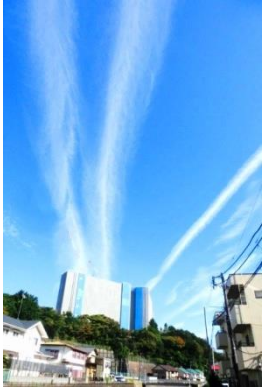
コンフォール藤が岡 の上空に飛行機雲 11月1日 13時

秋から冬へ、季節は着々と移り変わりつつあります。間もなく、この地域にも雪がちらつくのでしょうか。