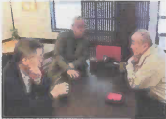
町内の「板そば」で先ず腹ごしらえ

毎年、町内の方々に声をかけ、大道東公園の桜見を続けていましたので、今年も4月1日に実行することになりました。友愛チームの協力で声掛けをして、14人の方で花見をしました。今回は、皆さんで会食会もして、ひと時を楽しみました。