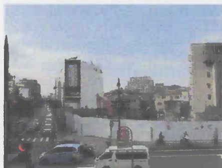
ラウンドホテルが姿を消しました