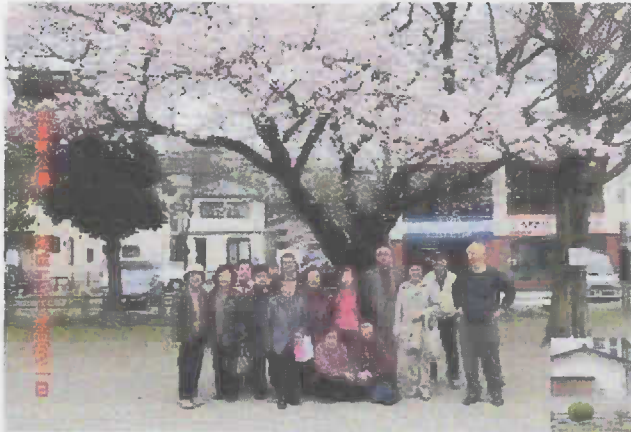
大道東公園で桜を楽しみました