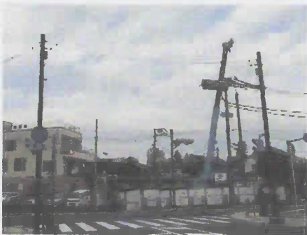
長谷医院まへの春日ビル（5F）が10階建てのマンションになります