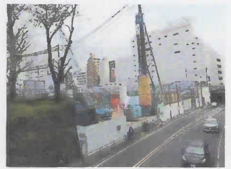
市役所旧館が生まれ変わります