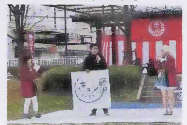
御殿辺公園でキュンとする藤沢の町づくりショウ