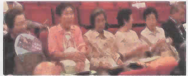
民謡・俵つみ唄 六会の天神ゆめくらぶ