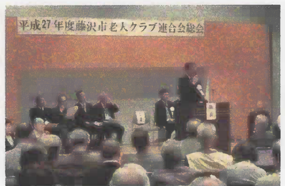
(藤沢市ゆめクラブでの鈴木市長挨拶)