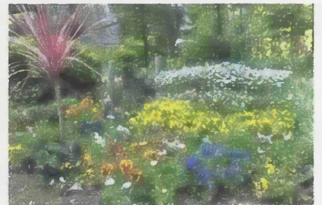
(藤が岡コンフォール内風景)