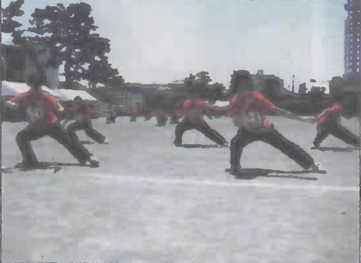
看護学校の生徒の贈りや学年対抗リレーを応援し元気な若いころを思い出しました。