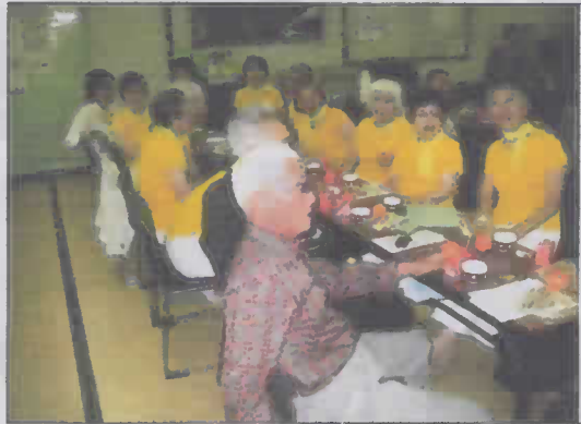
東部地区老連総会で出演待ちの新西富女性コーラス部の面々