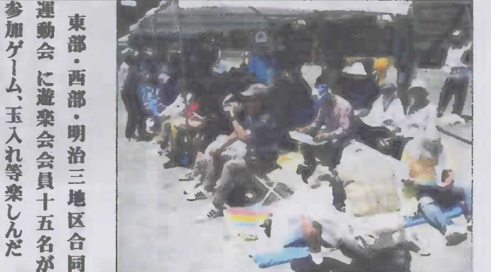
東部・西部・明治三地区合同運動会に遊楽会会員十五名が参加ゲーム、玉入れ等楽しんだ