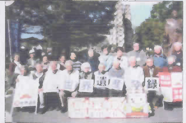
⑤写真 日帰りバス旅行 世界遺産 伊豆韮山反射炉 ⑥写真 社体協グラウンド ゴルフ大会 A組優勝